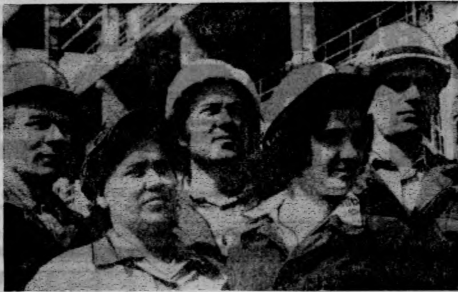
Цех № 5 химзавода — один из лучших не только по производственным показателям, но и по культуре производства. Коллектив цеха коммунистического труда успешно борется за достойную встречу 60-летия Великого Октября.